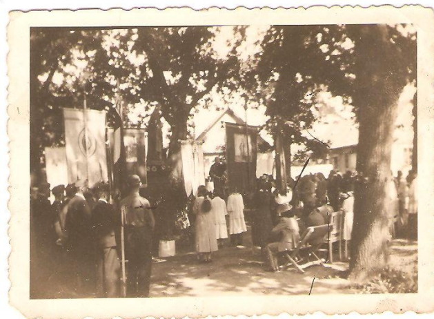
Az 1940-es évek végéig minden augusztus 20-án a Millenniumi Facsoportnál tartották a szentmisét

A litkei Plébánia irattárában megtalálható az a kézzel írott dokumentum (ma úgy mondanánk: forgatókönyv), amely az ünnepsorozat megrendezéséről szól: időpontok, felvonulások, az események helyszínei stb.